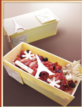
Cadeau de Noël クリスマスプレゼント

熊本県産の栗を使用したモンブランクリーム。中には、低脂肪の無糖生クリームを使用。クリームの中央とタルトの中に渋皮栗がゴロゴロと入った当店人気No.1のXmasケーキ。