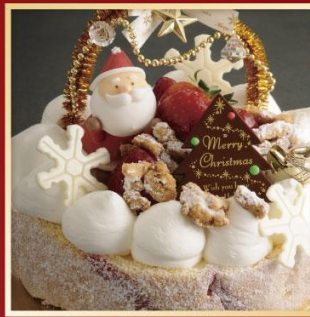
Crumble Fromage クランブル フロマージュ

蜂蜜を使用し焼き上げたフワフワなスポンジに、甘さ控えめな上質の生クリーム、国産の苺を使用したJoëlle特製デコレーションケーキ。