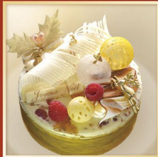
Nougat montelimar pistache ヌガール・モンテリマル ピスタチュー

カカオ分80%のショコラを使用し、ロドけの良いなめらかなショコラのクリームをサンド。風味豊かなショコラの味わいとローストカカオのカリカリした食感がアクセントのJoëlle定番チョコレートケーキ。