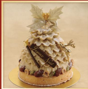
Noël Mont-blanc ノエル モンブラン

ベルギー産のショコラクリームとピスタチオのパパロア・スポンジが重なり、ココのあるリッチなおいしさに。蜂蜜の風味と香ばしいヌガールが調和し濃厚な味わいに。