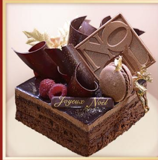
Delice chocolat デリシショコラ

北海道産のクリームチーズムースの中に、甘酸っぱいフランボワーズをベリーのソースでからめ閉じ込めました。