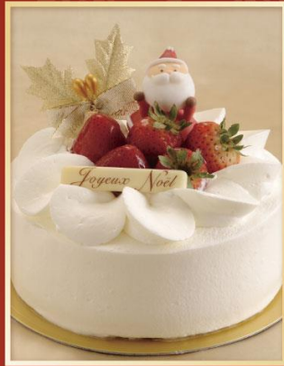
Gâteau fraise ガトーフレーズ

12cm ¥2,800 (税込¥3,024) 15cm ¥3,500 (税込¥3,780) 18cm ¥4,350 (税込¥4,698)